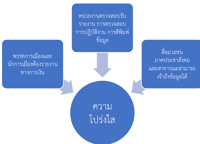
ภาพที่ 5 ความโปร่งใสด้านการเงินทางการเมือง

(3) ความโปร่งใสเกี่ยวกับสถานที่ที่พรรคต่าง ๆ ได้รับเงินทุนและวิธีการใช้จ่าย โดยเสนอว่าควรตั้งกฎเรื่องความโปร่งใสขึ้นมา เนื่องจากเป็นสิ่งสำคัญในการพิจารณาระบบการเงินทางการเมือง อาทิ ข้อมูลเกี่ยวกับสถานที่ที่พรรคและผู้สมัครรับเงินและวิธีที่พวกเขาใช้จ่ายไปควรได้รับการตรวจสอบ ควรกำหนดให้รายงานตรงเวลามีรายละเอียดครอบคลุมและเข้าใจได้และจำเป็นต้องมีข้อมูลที่เพียงพอที่จะมานำเสนอในลักษณะที่ช่วยให้สามารถกำกับดูแลและตรวจสอบการปฏิบัติตามข้อกำหนดได้อย่างมีความหมาย ในขณะเดียวกันต้องคำนึงถึงความต้องการของผู้ที่ต้องปฏิบัติตามข้อกำหนดการรายงานอีกด้วย อีกทั้งต้องพิจารณาด้วยว่าข้อมูลที่รายงานต่อหน่วยงานกำกับดูแลจะเปิดเผยต่อสาธารณะมากน้อยเพียงใดเมื่อใดและในรูปแบบใด อาจมีการใช้เครื่องมือดิจิทัลเพื่อช่วยอำนวยความสะดวกในการป้อนการส่งและการตรวจสอบข้อมูลที่จะรายงาน