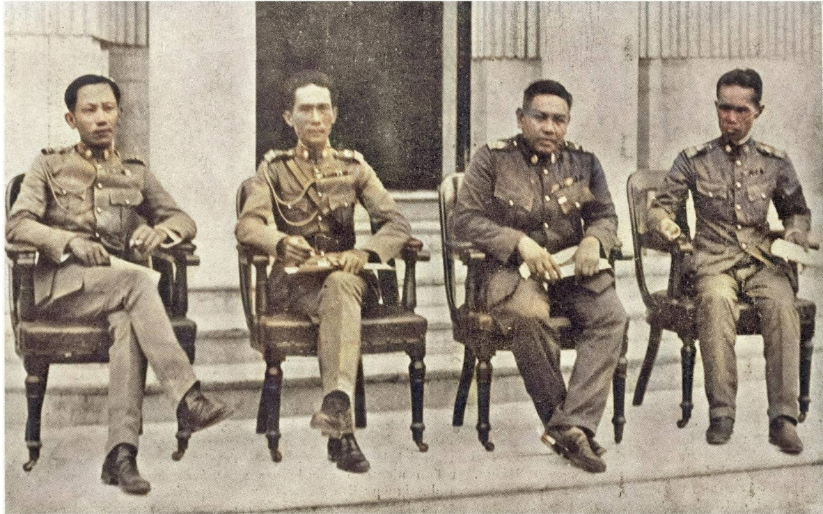
สี่ทหารเสือ นำโดยนายพันเอก พระยาพลพลพยุหเสนา ผู้เป็นหัวหน้าคณะผู้ก่อการฯ นายพันเอก พระยาทรงสุรเดช นายพันเอก พระยาฤทธิอัคเนย์ และ นายพันโท พระประศาสน์พิทยายุทธ