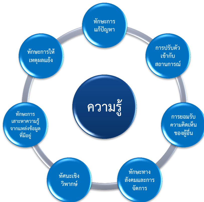
ภาพ 1 องค์ประกอบของสิ่งที่รวมกันเป็นความรู้ (สรุปจาก Borhaug, 2010)

ผู้วางระบบการศึกษาของนอร์เวย์มองว่า ความรู้ไม่ควรจะจำกัดอยู่แต่เพียงตัวองค์ความรู้ หรือการประยุกต์ใช้ความรู้เท่านั้น แต่ความรู้ควรประกอบไปด้วยสิ่งต่าง ๆ ต่อไปนี้ด้วย