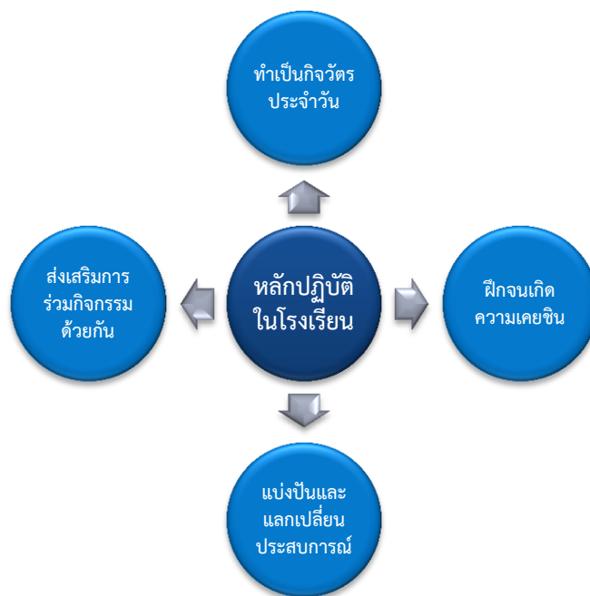
ภาพ 2 หลักปฏิบัติที่สำคัญในการดำเนินการสร้างพลเมืองในโรงเรียนของญี่ปุ่น

หลักปฏิบัติเพื่อสร้างความเป็นพลเมืองผ่านการเรียนการสอนในโรงเรียนตามแนวทางของประเทศญี่ปุ่น (Everyday Practice of Citizenship Education) ไม่เพียงแต่การมุ่งเน้นสิ่งที่จะเลือกเข้ามาสอนในโรงเรียนแต่ยังมุ่งหนุนเสริมให้นักเรียนมีพื้นที่เพื่อทำกิจกรรมเสริมสร้างความเป็นพลเมืองในชุมชนของตนเองด้วย