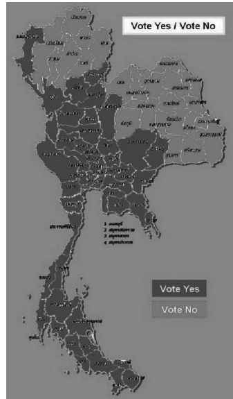
รูปที่ 2 แสดงภาพจังหวัดที่ออกเสียงรับร่างรัฐธรรมนูญฯ วันที่ 19 สิงหาคม 2550 เป็นอัตราร้อยละของจำนวนผู้ออกเสียงทั้งหมด